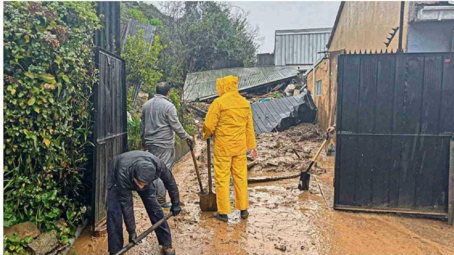
DEL TOTAL DE DAMNIFICADOS, CASI EL 95% CORRESPONDE A LA REGIÓN DEL BIOBÍO; 10.430 PERSONAS.

Acercado de lo que viene en los próximos días en la tarea de recuperación, el ministro expuso que "hemos tomado la decisión de fortalecer la capacidad de distribución, pidiendo a todos los servicios públicos que colaboren con recursos humanos, pero también con medios de