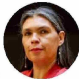
BÁRBARA FIGUEROA, Expresidenta de la CUT

Con él existía la posibilidad de entendernos con mucho respeto y de abrirse a la reflexión conjunta, cautivándose con los argumentos del otro"