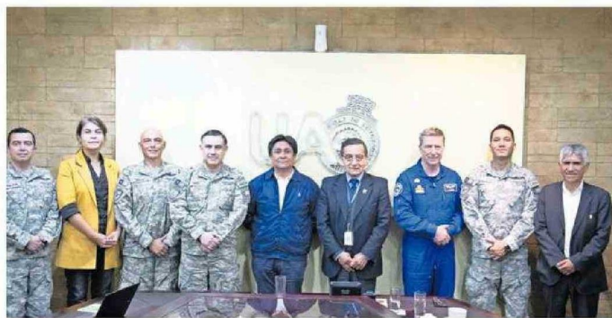
REPRESENTANTES DE LA UA, FACH Y EL GOBIERNO REGIONAL SE REUNIERON PARA COORDINAR EL PROYECTO.

Es por ello que durante estos días se realizó una reunión en la Universidad de Antofagasta (UA), casa de estudios que tendrá la misión de enfocarse en el desarrollo de capital humano y de los diseños de laboratorios para la construcción y operación de satélites de comunicaciones, gracias a la experiencia de sus centros de Investigación, Tecnología, Educación y Vinculación Astronómica (Citeva) o de Fisiología y Medicina de AL-