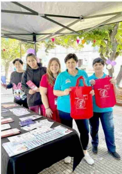
La prevención de enfermedades es fundamental.

Este operativo representa un fuerte compromiso de la municipalidad con la salud y el bienestar de las mujeres en Molina, así co-