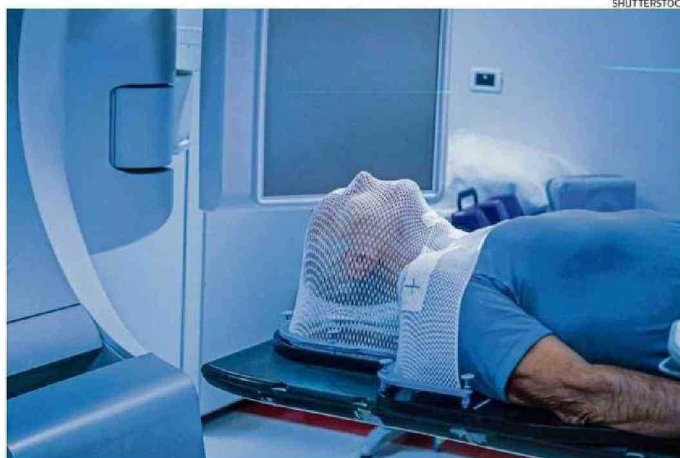
ELIMINAR LA PROTEÍNA STING AUMENTA LA TASA DE SUPERVIVENCIA.