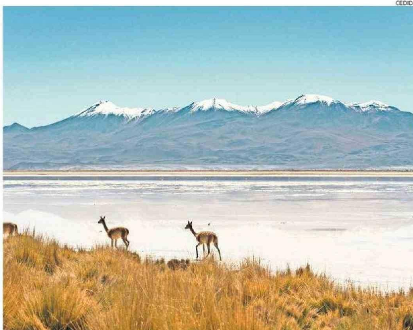
EL SALAR DE ASCOTÁN ESTÁ UBICADO A CERCA DE 150 KM AL ESTE DE CALAMA, EN LA COMUNA DE OLLAGÜE.