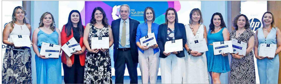
Las diez finalistas del Premio Ada Byron Chile. En esta segunda versión, UNAB recibió más de 180 postulaciones y nominaciones totales.

Tiraje: 126.654 Lectoría: 320.543 Favorabilidad: No Definida