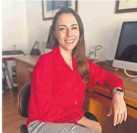
CHURRUCO ES UNA DE LAS AUTORAS DE LA INVESTIGACIÓN.

En esa línea, la especialista plantea que “a diferencia de otros métodos como la saliva, la orina o la sangre, el análisis de uñas permite evaluar el estrés acumulado durante un perio-