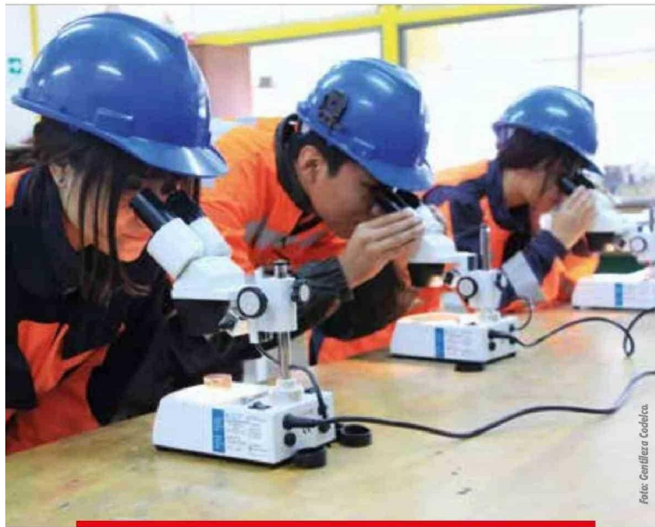
Feria Técnico-Profesional del Colegio Don Bosco.

la industria minera demandará en los próximos años, asegurándonos de que esta futura demanda se traduzca en una oferta académica concreta”.