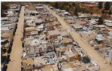
LA MAYOR PARTE DE LAS VIVIENDAS YA FUERON DESMANTELADAS.

se inició el procedimiento de desalojo de la toma, tal como lo había ordenado la Corte de Apelaciones de Valparaíso. Carabineros contó con refuerzos provenientes de Santiago.