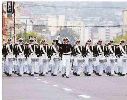
LA ESCUELA NAVAL “ARTURO PRAT” TUVO UNA DESTACADA PRESENTACIÓN.

En el desfile también participaron distintos clubes de cueca, organizaciones folclóricas y de huasos de la región. En la cere-