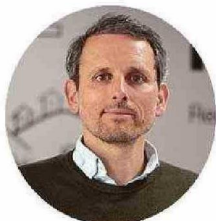
POR TOMÁS VILLARROEL, INVESTIGADOR PIENSA

Y a es un lugar común, una frase casi hueca, decir que Chile es un país resiliente. Lo mismo se ha dicho, en un sentido u otro, de Valparaíso. Con todo, la realidad de los últimos meses, quizá del último año, es que la ciudad se ha recuperado de las debacle que fueron para el puerto, primero, el estallido social y, luego, el cierre de la pandemia. El aire que se respira al transitar por las calles de Valparaíso, por cierto, aquel Valparaíso acotado a los cerros Alegre y Concepción (y con suerte dos más), exuda vibración, y se percibe una revitalización palpable al transitar por sus calles, pasajes y escaleras. Los vecinos han vuelto a salir al barrio, los visitantes inundan sus calles, las tiendas han vuelto a abrir sus puertas y otros comercios se han instalado por primera vez. Todo esto hace frente a un Valparaíso que, en un porcentaje mayoritario, sigue sumido en la pendiente de la decadencia.