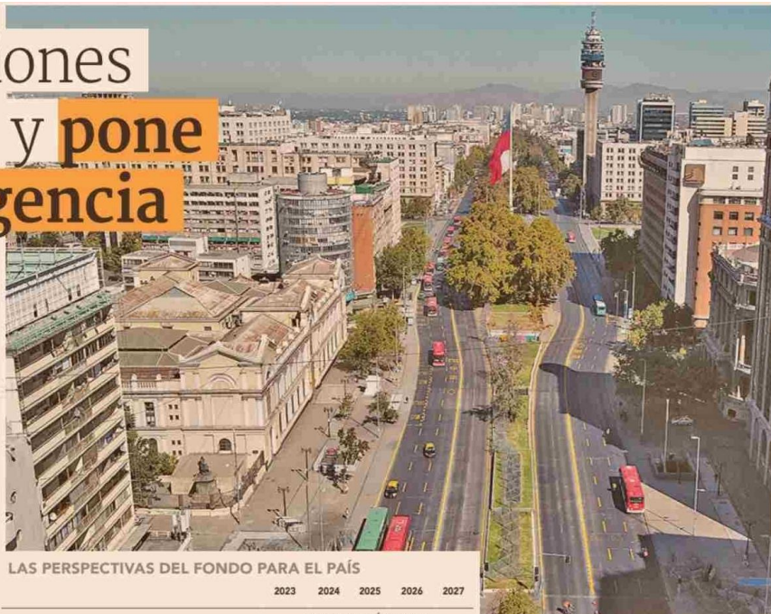
LAS PERSPECTIVAS DEL FONDO PARA EL PAÍS

"Las necesidades políticas son ahora principalmente de carácter estructural. Las prioridades incluyen impulsar el crecimiento y el empleo a mediano plazo, reforzar las reservas fiscales, del sector financiero e internacionales, especialmente en el contexto de un entorno mundial difícil, y seguir reduciendo la desigualdad".