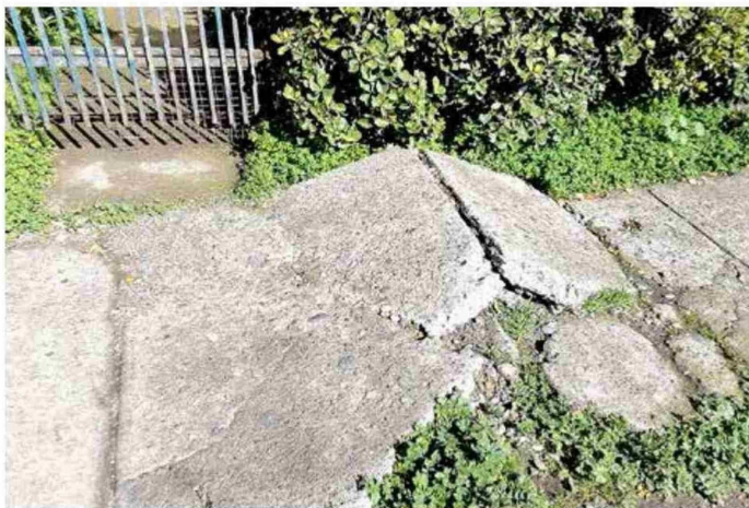
Inconcebible, pero cierto. Las veredas de Villa Padre Hurtado no pueden ser utilizadas con facilidad.

“Este es un proyecto participativo donde nosotros cumplimos con entregar el aporte que nos corresponde, pero según la información que entregó el municipio, fue dividido en dos partes por falta de recursos del Serviu, quedando finiquitado solo una parte, quedando cuatro pasajes sin intervenir. La verdad es que tenemos muchos adultos mayores en nuestra villa, quienes sufren las con-