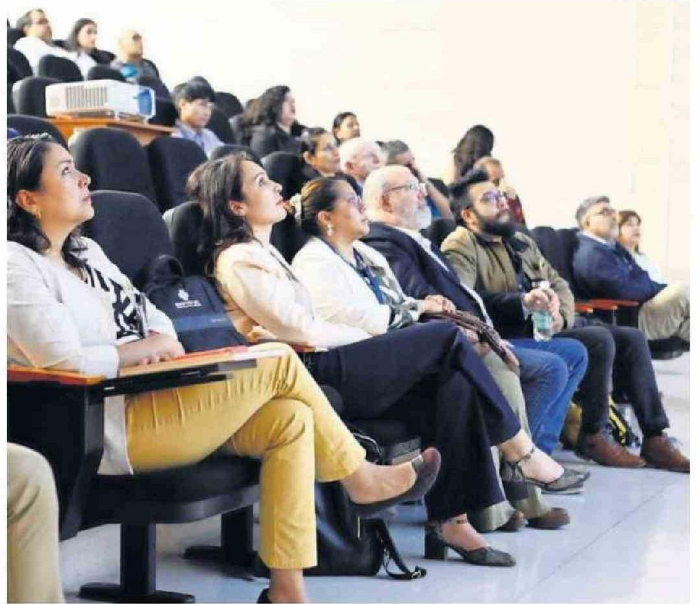
EL FORO REUNIÓ A 40 ESPECIALISTAS EN SALUD.

"Anhelábamos desarrollar esta actividad en la Región de Antofagasta, el poder ahondar en esta temática es algo que nos desafía a diario porque las necesidades en esta zona son distintas a las del resto del pa-