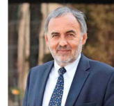
CECILIA HIDALGO PRESIDENTA DE LA ACADEMIA CHILENA DE CIENCIAS

“Un país fragmentado, con escasa conciencia de que somos ciudadanos interdependientes, difícilmente tendrá la capacidad de adaptación al incierto futuro que tenemos por delante”.