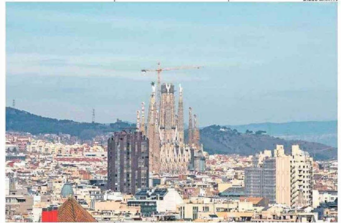
BARCELONA ES UNA CIUDAD COMPACTA DE ALTA DENSIDAD, SEGÚN EL ESTUDIO.