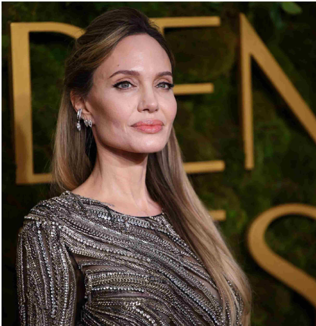
► La actriz Angelina Jolie se perfilaba como una de las favoritas para conquistar el galardón a Mejor actriz de drama.

Los Oscar revelarán a sus nominados el próximo 17 de enero. En tanto, la ceremonia se desarrollará el 2 de marzo. ●