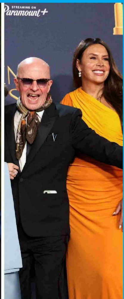
► Los actores Demi Moore, Timothée Chalamet, y el director Jacques Audiard junto a la actriz Karla Sofia Gascón.