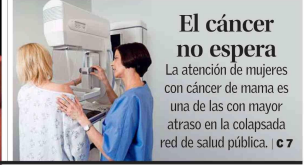
El cáncer no espera La atención de mujeres con cáncer de mama es una de las con mayor atraso en la colapsada red de salud pública. C 7