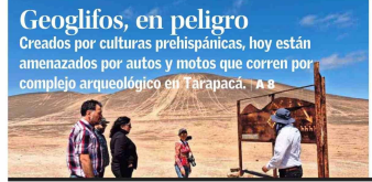
Geoglifos, en peligro Creados por culturas prehispánicas, hoy están amenazados por autos y motos que corren por complejo arqueológico en Tarapacá. A 8

FUNDADO EN VALPARAÍSO EL 12 DE SEPTIEMBRE DE 1827 / AÑO CCXCVII N° 68.136 / MCR SANTIAGO DE CHILE, MIÉRCOLES 4 DE SEPTIEMBRE DE 2024 FUNDADO EN SANTIAGO EL 1 DE JUNIO DE 1980 / AÑO CCXXV N° 44.958 (ES PROPIEDAD)