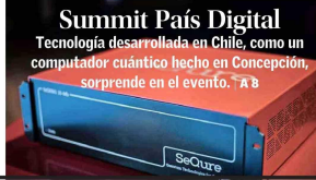
Summit País Digital Tecnología desarrollada en Chile, como un computador cuántico hecho en Concepción, sorprende en el evento. A 8