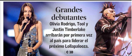
Grandes debutantes Olivia Rodrigo, Tool y Justin Timberlake arribarán por primera vez al país para liderar el próximo Lollapalooza. | C 10