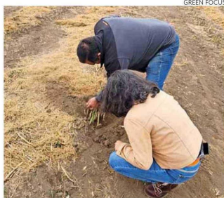
Algaflex ha demostrado ser eficaz inhibiendo patógenos alimentarios.