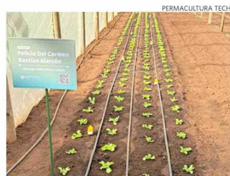
Estas lechugas las riegan a partir de las indicaciones de la IA.

Así, están desarrollando es una inteligencia artificial que monitorea y controla el riego, creando un sistema que permita que la aplicación del riego sea adecuada según las condiciones climáticas, esto a través del análisis del ecosistema y las condiciones en las que se desarrolla el cultivo.