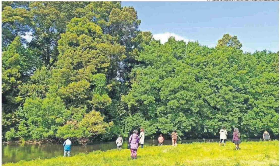
EL PARQUE MUNICIPAL UNIONINO SE UBICA A ORILLAS DEL RÍO LLOLEHUE, EN LA CAPITAL DE LA PROVINCIA DEL RANCO.