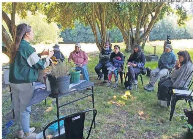
UNO DE LOS EFECTOS DEL PROYECTO HA SIDO EL INTERÉS DE LA COMUNIDAD POR LA BIODIVERSIDAD LOCAL.

Asimismo, Figueroa indicó que dentro de la iniciativa se consideraron actividades de educación ambiental comunitaria, co-