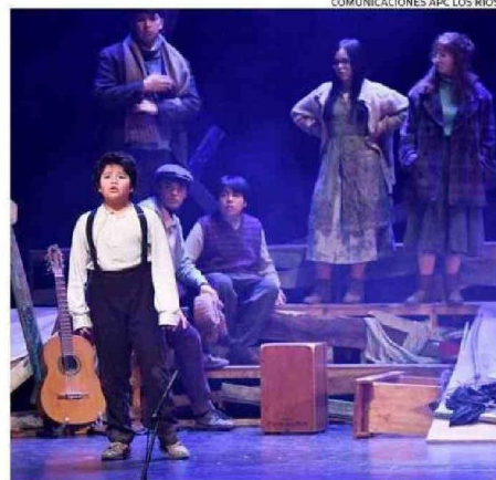
COMUNICACIONES APC LOS RÍOS.