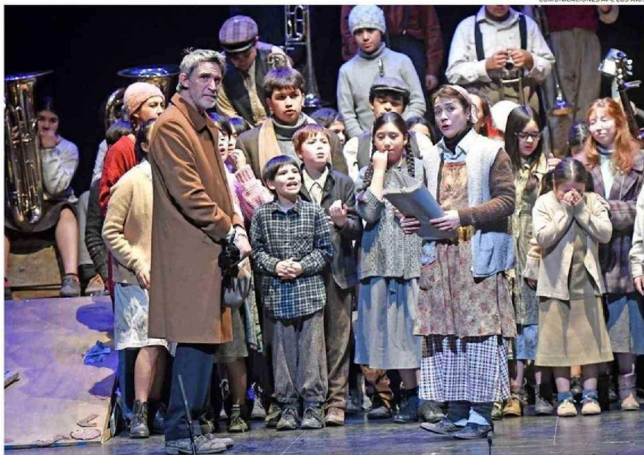
EL AFAMADO ACTOR DE TEATRO Y TV, FRANCISCO MELO, LIDERÓ ELENCO QUE IGUAL INCORPORÓ A PEQUEÑOS ESCOLARES DE LA COMUNA LACUSTRE.

La exhibición contó con el financiamiento del Ministerio de las Culturas, las Artes y el Patrimonio a través de su Programa de Apoyo a Organizaciones Culturales Colaboradoras. CS