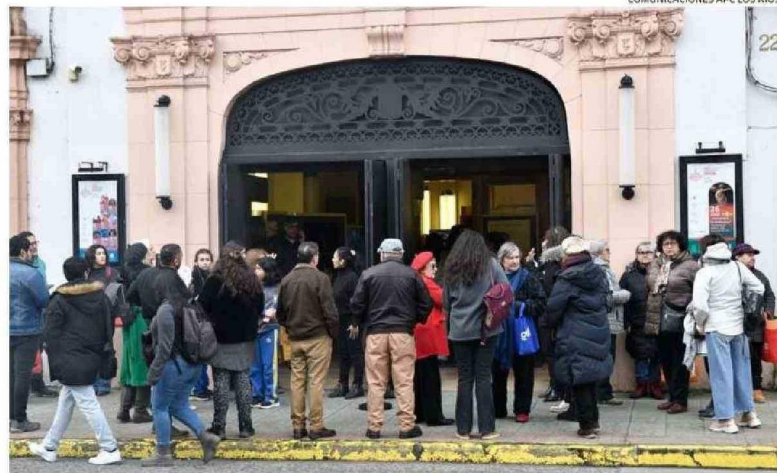
COMUNICACIONES APC LOS RÍOS.