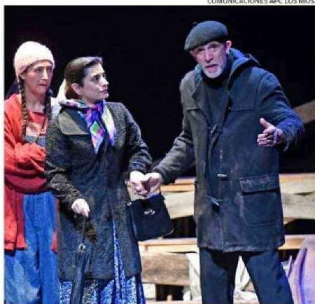
COMUNICACIONES APC LOS RÍOS.