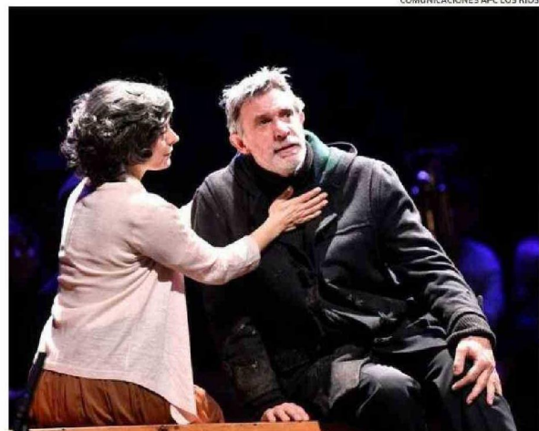
COMUNICACIONES APC LOS RÍOS.