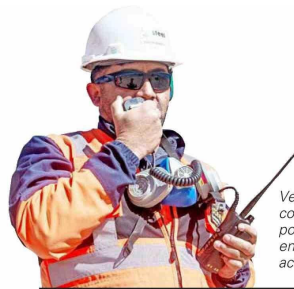
Veltis Latam y sus compañías operativas ponen a sus trabajadores en el centro de su actividad.

En el mes de la minería, adquiere especial relevancia la importancia de las personas y cómo la cultura organizacional impulsa la excelencia en las operaciones mineras. Este es el caso de Veltis Latam —antes Ferrovial Servicios Chile—, donde el trabajo realizado es esencialmente llevado a cabo por personas y se centra en conectar a todos los trabajadores con cinco valores: excelencia, seguridad, colaboración, integridad e innovación.