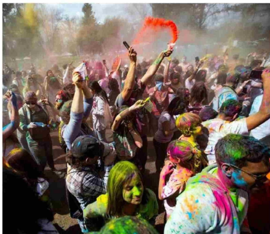
LA FIESTA DE COLORES convocaba a miles de jóvenes en torno a la música electrónica.

Además, hizo ver que oficinas del municipio de Los Ángeles y la Corporación Cultural Municipal se encuentran trabajando codo a codo para llevar a cabo diversas actividades en los próximos meses, como el Clasificador Zona Sur de rodeo, a realizarse entre el 28 de febrero y el 3 de marzo.