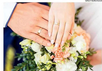
EN CHILE, HAY QUIENES ACUMULAN 4, 5 Y HASTA 6 MATRIMONIOS.

Los datos del Registro Civil también muestran que en el mismo periodo -mayo de 2004 a noviembre de 2018-, un total de 888.256 parejas han contra-