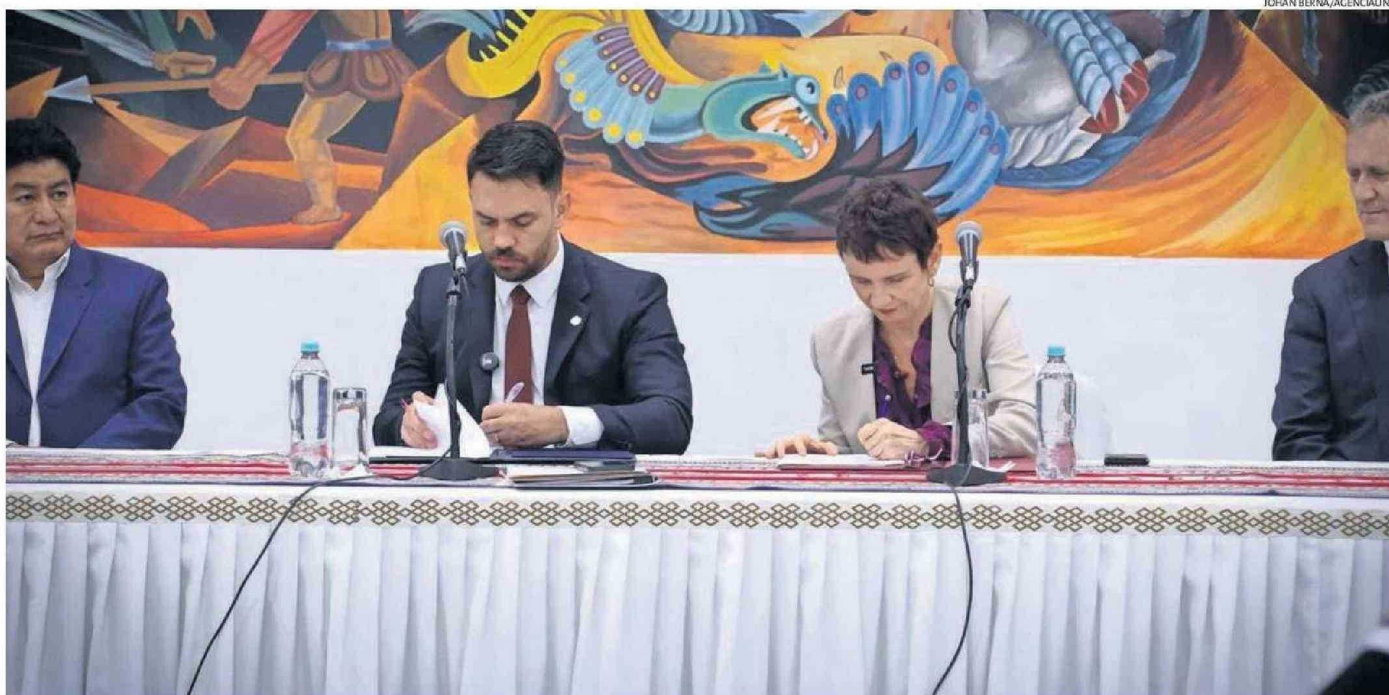
CON LA FIRMA MATERIALIZADA EL JUEVES EN LA PAZ ENTRE CHILE Y BOLIVIA, AMBOS PAÍSES APLICARÁN EN FORMA INMEDIATA LOS PROCEDIMIENTOS DE RECONDUCCIÓN EN LA FRONTERA.