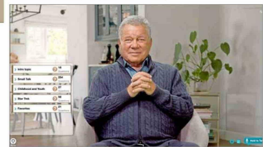
En la foto, la plataforma StoryFile, donde se muestra cómo se podría interactuar con un avatar. Se observa la réplica digital del actor William Shatner, conocido por su rol de capitán Kirk en la serie "Star Trek" y embajador del sitio.