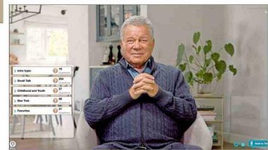
En la foto, la plataforma StoryFile, donde se muestra cómo se podría interactuar con un avatar. Se observa la réplica digital del actor William Shatner, conocido por su rol de capitán Kirk en la serie "Star Trek" y embajador del sitio.