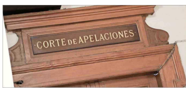
UNÁNIME —La decisión de la Corte de Apelaciones de Santiago se adoptó de manera unánime.

Si bien, en 2018, el entonces contralor Jorge Bermúdez estableció un criterio mediante el cual se aplicaba la confianza legítima cuando un funcionario cumplía dos años en su puesto, es decir, que podía tener la legítima expectativa de que fuera renovado en su cargo al cabo de ese tiempo; pero, en no-