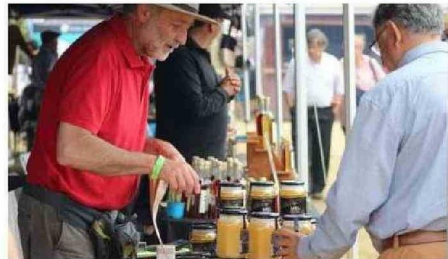
DESDE HACE AÑOS SE PUEDE ADQUIRIR EN LAS MUESTRAS DE CHONCHI PRODUCTOS COMO MIEL, LICORES Y CERVEZA DE BARRIL.

A dos semanas de la gran Fiesta Criolla, el Parque Municipal Notuco acogió la decimonovena versión de la Expo Bosque, iniciativa organizada por la Agrupación de Productores Locales El Canelo, la Corporación Nacional Forestal (Conaf) y la Municipalidad de Chonchi. ☺