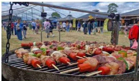
LOS TÍPICOS ANTICUCHOS CHILOTES SE COCINARON AL PASO DE LOS CHILOTES Y TURISTAS.