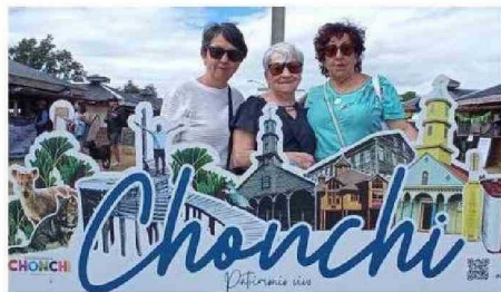
JUNTO ESTE HERMOSO CARTEL DE ATRACTIVOS CHONCHINOS SE FOTOGRAFIARON ASISTENTES A LA CITA DEL FIN DE SEMANA.