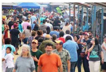
MILES VISITARON LA EXPOSICIÓN EN SUS DOS DÍAS.