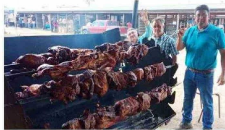
LOS ASADOS ESTÁN ENTRE LOS PLATOS PREFERIDOS DE LAS FIESTAS.