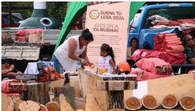
LA LEÑA SECA, UN COMBUSTIBLE QUE AÚN MUCHOS NO UTILIZAN EN LA ZONA, FUE PARTE DE LA MUESTRA IMPULSADA POR ALIANZA ENTRE EL SECTOR PÚBLICO Y EL PRIVADO.