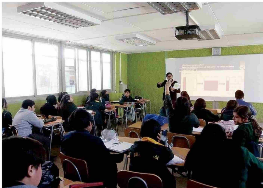
LA EDUCACIÓN AMBIENTAL PASÓ A SER UNA OBLIGACIÓN DEL ESTADO CON LA LEY DE BASES DEL MEDIO AMBIENTE.

Ejemplos concretos de lo anterior son los trabajos articulados que se han efectuado en conjunto con el Ministerio de Medio Am-