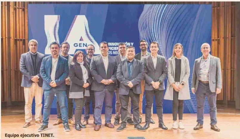
Equipo ejecutivo TINET.

Conocer el impacto de la IA generativa en los negocios y analizar sus beneficios a partir de los casos reales en Chile de Coca-Cola Andina y Consorcio, fueron algunas de las primicias del evento "IA transforma: innovación y eficiencia para los negocios", organizado por TINET, AWS y la U. Federico Santa María.