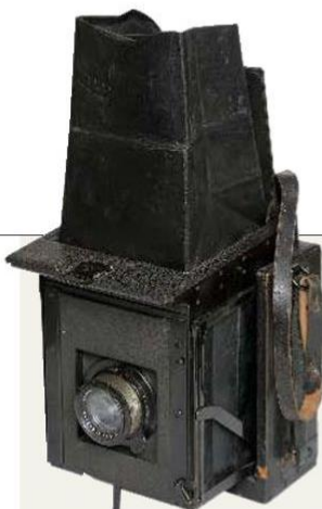
CÁMARA MODULAR Mentor de fuelle y placas. Es expandible y su lente Carl Zeiss tiene hilo helicoidal.