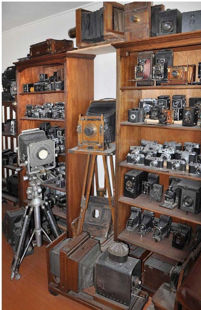
EL OCHENTA POR ciento de las cámaras de esta colección está en perfectas condiciones y funcionando.