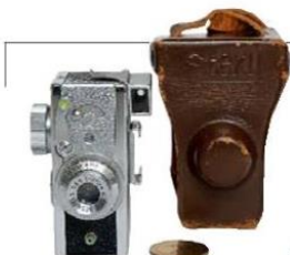
MINIATURA DE LA serie Steky; cámara de 16 mm introducida en Japón después de la Segunda Guerra Mundial. Tiene su estuche de cuero original. Mide solo 6 cm de alto y 3 cm de ancho.