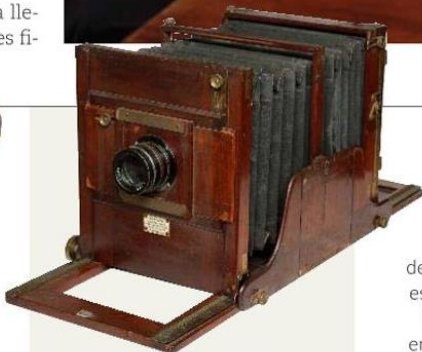
LA MÁS ANTIGUA de la colección: cámara inglesa Meagher, introducida en los años 1880, con sistema de fuelle y placas de cristal.