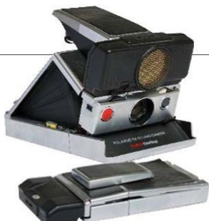
POLAROID SX-70, modelo tipo zapatilla, que se desplaza, arma y convierte en cámara. Es una pieza rara y muy difícil de encontrar, que fue lanzada al mercado en 1972.

Hasta el momento, su conjunto cuenta con 250 piezas, entre las que hay un par de cámaras minuteritas o de cajón, además de un Taxiphote, aparato para la visión estereoscópica fabricado en 1891 y patentado en 1899 por el francés Jules Richard, y un par de proyectores. VD