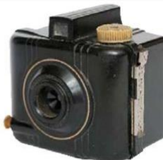
LA PRIMERA: con esta Baby Brownie Special de Kodak, introducida en 1939, inició la colección hace dos décadas. Perteneció a su padre.