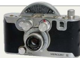
PERTENECIÓ A UN soldado norteamericano que peleó en la Segunda Guerra Mundial. Esta Mercury II es la pieza más rara de la colección porque tiene obturador redondo y captura medio cuadro.