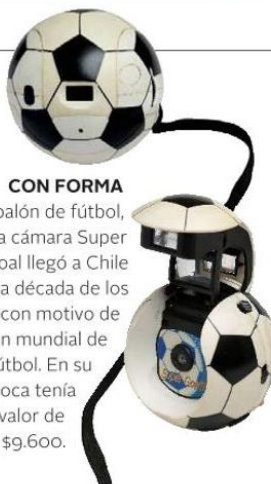
CON FORMA de balón de fútbol, esta cámara Super Goal llegó a Chile en la década de los 70 con motivo de un mundial de fútbol. En su época tenía un valor de $9.600.