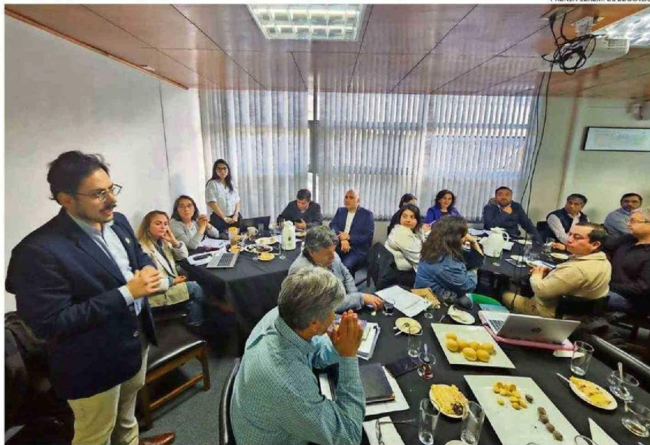
REUNIONES DE TRABAJO, TALLERES Y ESPACIOS PARA FOMENTAR EL TRABAJO EN EQUIPO, HAN DESARROLLADO DESDE LA SEREMÍA Y EL SLEP.

“Uno de los objetivos sobre los cuales estamos trabajando es entender la relación sistémica de toda la institucionalidad educativa en el país. Todos tenemos que actuar como sistema y, sobre la base de eso, trazar objetivos comunes que nos permitan la mejora educativa”.