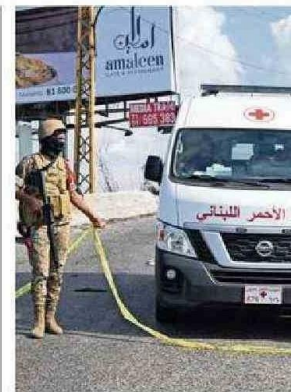
CRUZ ROJA LIBANESA SE DIRIGE AL ES

La Agencia Estatal de Meteorología (Aemet) anunció que activó nuevos avisos para hoy por lluvias y tormentas.