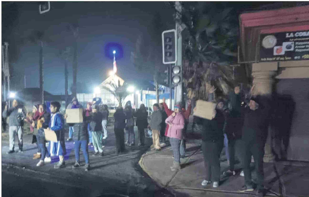
Manifestaciones en San Felipe, Santiago y Panguipulli