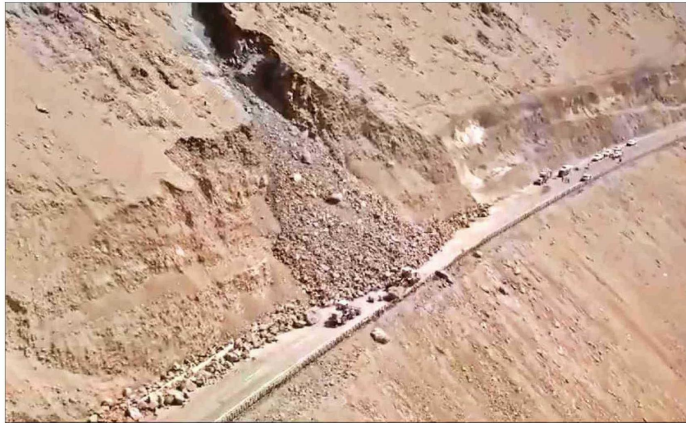
USO DE MAQUINARIA PESADA PARA REMOVER ROCAS. — Hasta siete rodados en un día han sido reportados por las autoridades desde la semana pasada en este tramo de la Ruta 5, en la cuesta Chinchorro.

de movimientos de tierra o rocas en los que se desprenden trozos de cerros. Un estudio elaborado por ese organismo, y que fue difundido en agosto pasado, identificó 5.360 eventos de remoción en masa ocurridos durante un período de 20 meses en esa región. De ellos, 588, equivalentes a un 11% del total, correspondieron a deslizamientos.