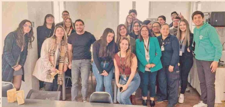
Charla de Diversidad e Inclusión.