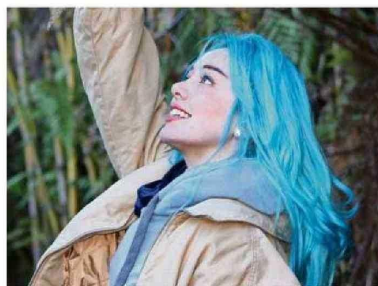
Cantante osornina y su refugio en el sur. Pág. 19

Provincia. En Puyehue y Octay recibieron una gran cantidad de turistas, mientras que en La Costa estuvo débil en alojamiento, aunque con abundante público en locales de comida. Págs. 2 y 3