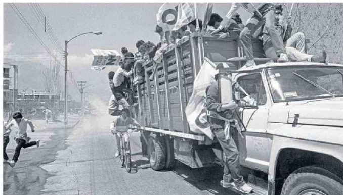
"Manifestantes por el No", podría ser el nombre de esta fotografía hecha en Santiago, el año 1988.

de los últimos 40 años, especialmente durante las protestas y manifestaciones contra la dictadura en los años 80 y durante la transición, Álvaro Hoppe, sostiene que la fotografía siempre está en contextos históricos y sociales. "Es un principio de una importancia