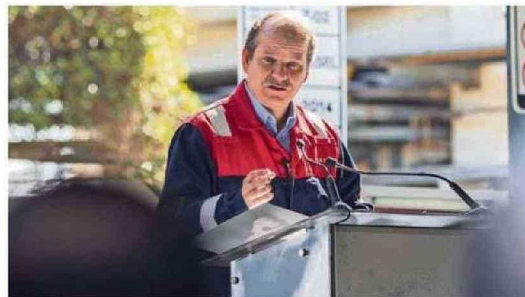
EL MINISTRO DE ENERGÍA, DIEGO PARDOW, INDICÓ QUE ESTE HITO DEMUESTRA QUE ENAP ESTÁ A LA VANGUARDIA EN INNOVACIÓN Y DESARROLLO TECNOLÓGICO EN EL CAMINO DE LA TRANSICIÓN ENERGÉTICA.