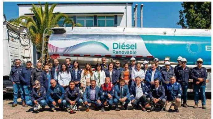
AUTORIDADES NACIONALES, REGIONALES Y EL EQUIPO ENAP DURANTE LA PRESENTACIÓN DEL DIÉSEL RENOVABLE ENAP, QUE REDUCE EN UN 80% LA HUELLA DE CO2 EQUIVALENTE POR CADA LITRO DE ACEITE USADO.

Este resultado confirma la identidad innovadora de Enap y la capacidad de adaptar su infraestructura para la generación de nuevos combustibles, promoviendo un circuito de economía circular. ♦