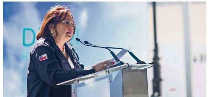
LA PRESIDENTA DEL DIRECTORIO DE ENAP, GLORIA MALDONADO, DESTACÓ QUE ESTE ES UN HITO EN EL PLAN ESTRATÉGICO 2040 DE LA EMPRESA, QUE BUSCA LIDERAR LA PRODUCCIÓN DE COMBUSTIBLES BAJOS EN CARBONO.