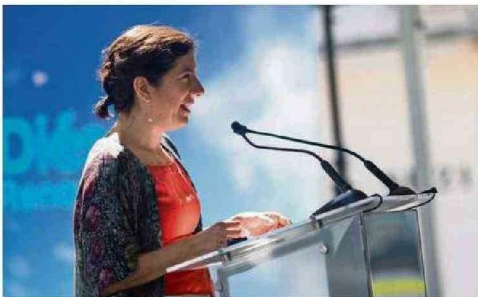
LA MINISTRA DE CIENCIA, TECNOLOGÍA, CONOCIMIENTO E INNOVACIÓN Y VOCERA (S) DE GOBIERNO, AISÉN ETCHEVERRY, DESTACÓ EL IMPACTO EN EL CUIDADO DEL MEDIOAMBIENTE.