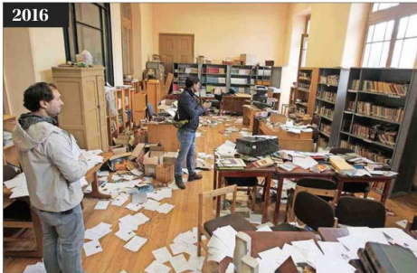
2016 Una toma de 19 días terminó con serios destrozos y pérdida de patrimonio del liceo, fundado en 1902.