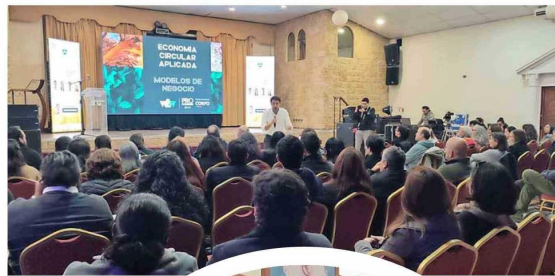
"Impulsa O'Higgins Sostenible" es parte de un programa de alta convocatoria que se adjudicó Corporación Pro O'Higgins, ejecutado con recursos Corfo.