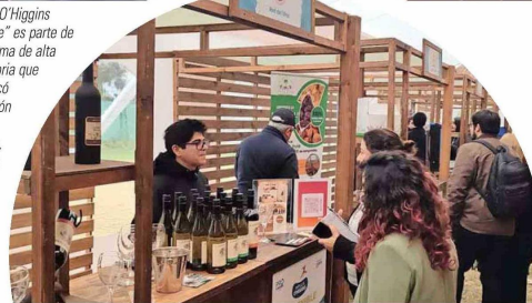
El evento internacional "Impulsa O'Higgins Sostenible" contó con una muestra de emprendimientos sostenibles relacionados con la economía circular y la adaptación al cambio climático.