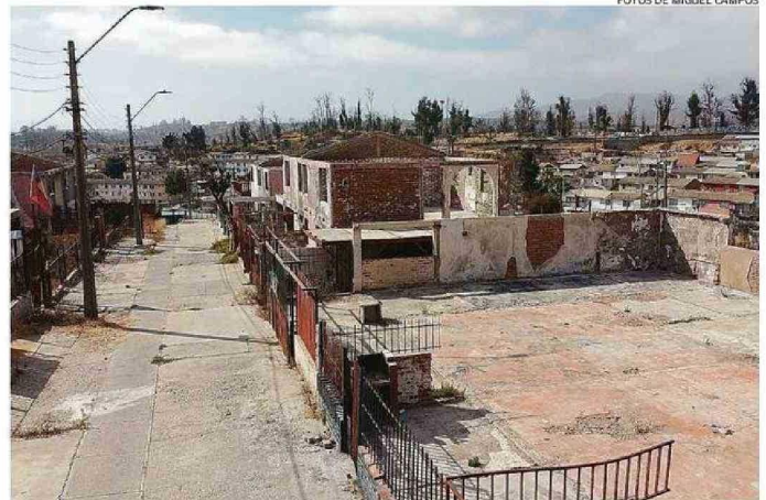
EL PASAJE RÍO CÓNDORES PERMANECE PRÁCTICAMENTE IGUAL QUE TRAS EL INCENDIO DEL 2 DE FEBRERO.

Expone Flores que la reconstrucción "da cuenta de una dinámica del Estado que cada día deja más que desear, por todos los procesos, todas las dificultades que se le han puesto a los veci-