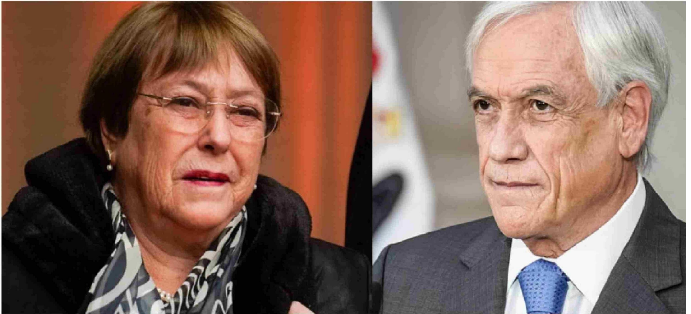
► Michelle Bachelet y Sebastián Piñera, expresidentes de Chile, tuvieron que declarar por los casos Caval y de lesa humanidad, respectivamente.