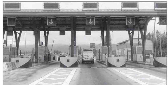
El peaje más caro de Chile está en Quillota.