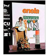
Autoridades y gremios abordaron problemas de la región.

EXJEFE DE MIGRACIONES: "FACILITA QUE OTRAS NACIONES EVADAN SUS RESPONSABILIDADES" | C 3