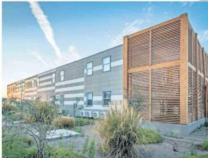
EL PROYECTO CONTEMPLA DOS EDIFICIOS Y 112 HABITACIONES, QUE SUMAN 4.000 METROS CUADRADOS.

Desde Tecno Fast, la empresa que realiza las obras, explicaron que la principal ventaja de la construcción con módulos es su velocidad, que permite un ahorro del 50% en los plazos. Adicionalmente, representa una solución sostenible que reduce el impacto ambiental, tanto acústico, del aire, co-