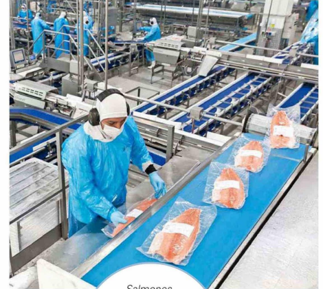
Salmones Camanchaca destaca por su compromiso generando empleo local, alcanzando un 87% de trabajadores provenientes de las zonas donde opera.

Sus avances en índices internacionales junto a otros logros consolidan la sostenibilidad como un pilar estratégico de la Compañía, reafirmando su compromiso con liderar la industria del salmón de manera responsable.