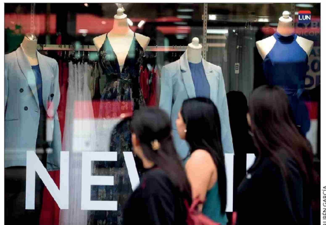
Las personas tienen más tiempo los sábados para darse el placer de comprar.

Sebastian Goldsack, académico de la Facultad de Comunicaciones